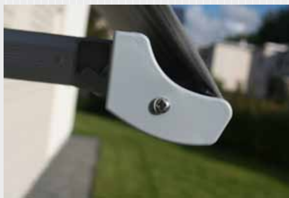
Fronten är designad och modern.

Markisstativet med detaljer finns som standard i 3 färger: Vitt, Grått och Svart med struktur. Med något längre leveranstid kan man få stativet i ytterligare 10 färger, matchade för att passa ihop med de vanligast förekommande husfärger och fasader.