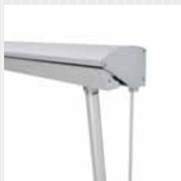
Utvändig manövrering med dragband av polyester.