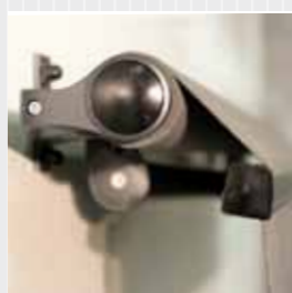
Designgavlarna på FA 24.