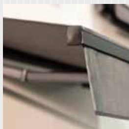
Frontprofil på FA 22.