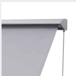
DA 30 markisen är utrustad med en aluminiumkassett som skyddar mot regn och smuts.